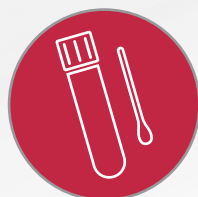
Prueba de Papanicolaou