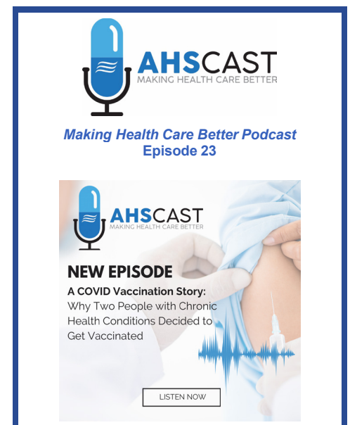
Figure 1 Haga clic en la imagen del podcast para escuchar.

Sintonícense mientras Holly y Abby comparten su experiencia al tomar la vacuna, lo que las hizo decidir hacerlo y cómo las ha impactado hoy.