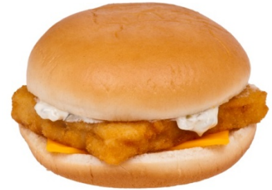
Sándwich de pescado