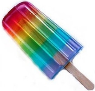
Helado de hielo